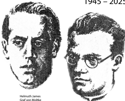
Helmut James Graf von Moltke † 23.1.1945