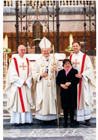
Bilder: Jim Stritzky